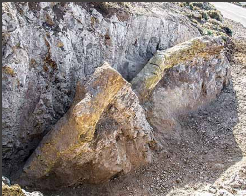
Γιγαντιαίοι απολιθωμένοι κορμιά δένδρων στο νέο οδικό άξονα Καλλονής - Σιγρίου