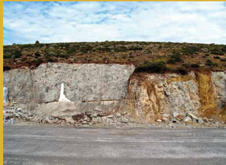
Πανοραμική άποψη των ανασκαφικών εργασιών που αποκάλυψαν μια ιδιαίτερα πλούσια απολιθωματοφόρα θέση.

Μια πρωτότυπη έκθεση που επιχειρεί να εστιάσει και στην ανθρώπινη προσπάθεια για τη διάσωση των απολιθωμάτων, δίνοντας πληροφορίες για τις διαδικασίες της ανασκαφής, της συντήρησης, της μεταφοράς και της τεκμηρίωσης των ευρημάτων, της χαρτογράφησης και της ανάδειξης των απολιθωμένων θέσεων.