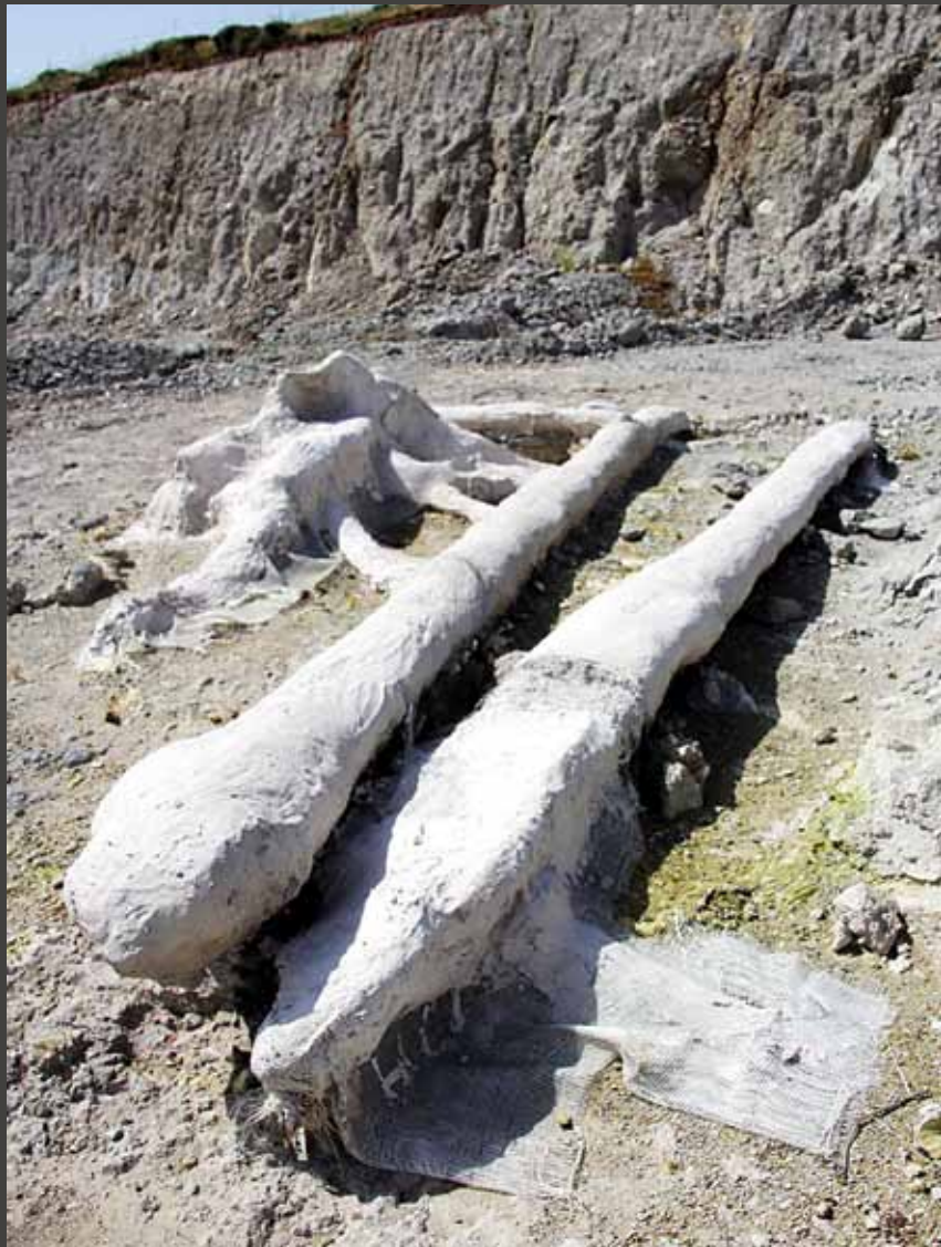
Κορμιά που έχουν συντηρηθεί και βρίσκονται στον οδικό άξονα Καλλονής - Σιγρίου