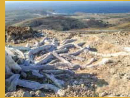
Εντυπωσιακό ριζικό σύστημα δένδρου Άποψη των εργασιών προστασίας